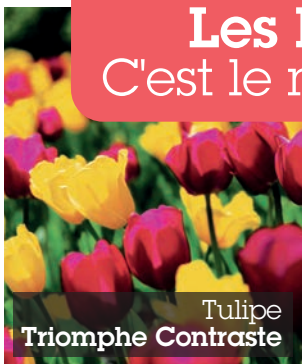
Tulipe Triomphe Contraste

Les bulbes d'automne à l'unité sont arrivés dans votre boutique, c'est donc le moment de faire vos plantations ! Les bulbes d'automne offrent une multitude de choix : formes, couleurs, tailles , à la floraison parfumée ou spectaculaire , en massif ou en pot... Nous avons sélectionné pour vous des variétés de grande qualité !