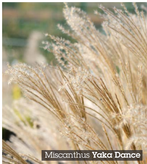
Misconthus Yoka Dance