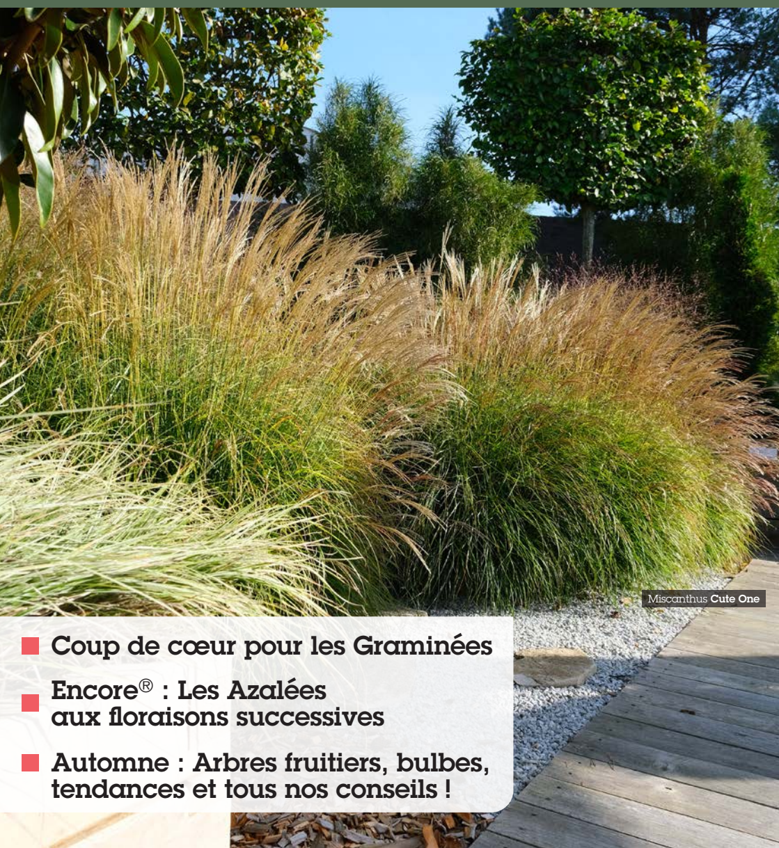
Miscanthus Cute One

Le magazine de La Paysagerie les Plantes