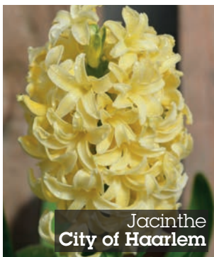
Jacinthe City of Haarlem