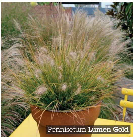
Pennisetum Lumen Gold

Les Carex Evercolor® sont élégants en toutes circonstances et offrent une multitude de couleurs ! Ne demandant que peu d'entretien , ils se plaisent partout ! En couvre-sol ou en massif, ils sont également parfaits en composition pour y donner du relief !